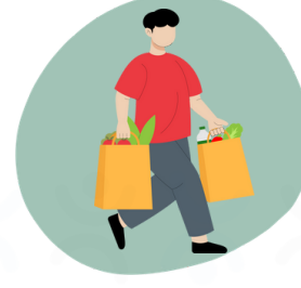
Posture pour porter ses sacs