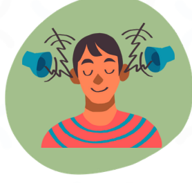
L'ambiance liée aux facteurs environnementaux