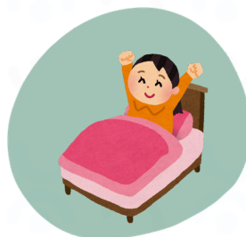
Sortir de son lit