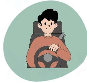
Posture en voiture