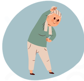
Étirement du dos