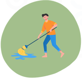
La vulnérabilité liée aux habitudes de vie