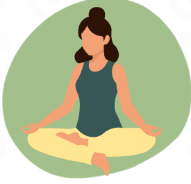
Les tensions liées aux émotions