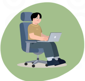
Les exigences liées au travail ou au quotidien