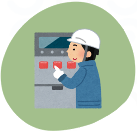
Les contraintes liées au mouvement