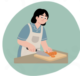
Posture en cuisine