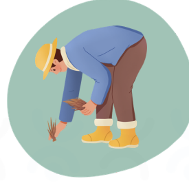
Posture pour ramasser au sol