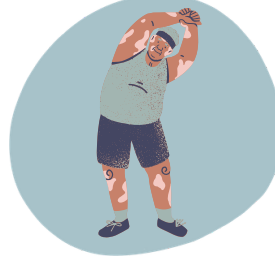
Étirement des hanches