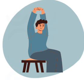
Étirement des épaules